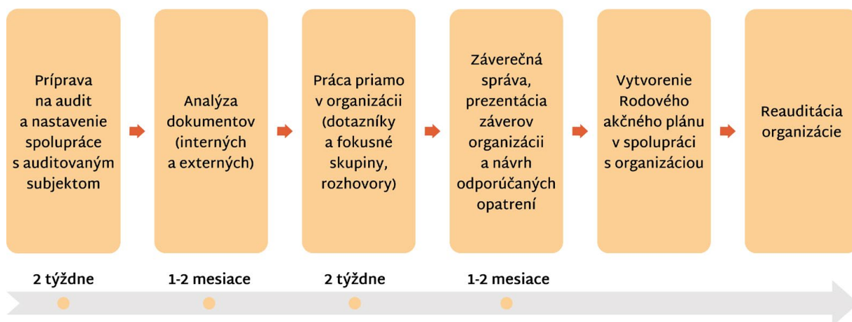
Obrázok 3: Fázy rodového auditu s orientačnou časovou osou

Predpokladaná časová os priebehu rodového auditu: